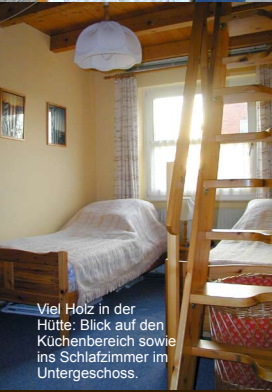
Viel Holz in der Hütte: Blick auf den Küchenbereich sowie ins Schlafzimmer im Untergeschoss.