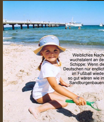
Weibliches Nachwuchstalent an der Schippe: Wenn die Deutschen nur endlich im Fußball wieder so gut wären wie im Sandburgenbauen.