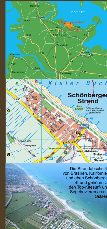
Die Strandabschnitte von Brasilien, Kalifornien und eben Schönberger Strand gehören zu den Top-Kitesurf- und Segelrevieren an der Ostsee.

An- und Abreisetag ist Samstag (abweichende Tage nur in der Reisezeit E). Damit der Bezug ihres Quartiers nicht zum Spießroutenlauf wird, haben wir für Sie kurze Wege eingeplant! Urlaub von Anfang an – gerade wenn die Staus auf der Autobahn nach langer Anreise an den Nerven gezeht haben. Bei Buchung erhalten Sie vorab alle wichtigen Infos zur Anfahrt, vor Ort erhalten Sie dann die Schlüssel zu ihrer Ferienwohnung (ersatzweise kann der auch abgeholt werden) und erfahren alles über Abreisezeit und Wohnungsübergabe. Über unseren Servicepartner können Sie in der Regel auch Zusatzleistungen wie Bettwäsche und Handtücher buchen.