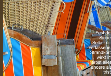
Fest der Sinne: Selbst ein verlassener Strandkorb wirkt im Herbst alles andere als trist.