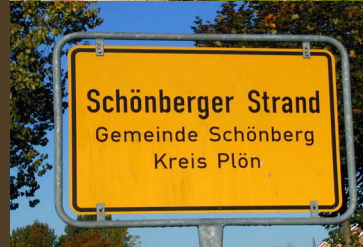
Schönberger Strand Gemeinde Schönberg Kreis Plön