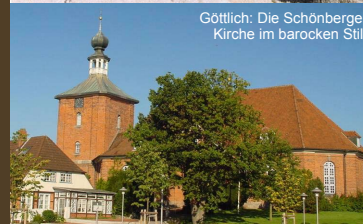
Göttlich: Die Schönberger Kirche im barocken Stil.