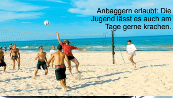
Anbaggern erlaubt: Die Jugend lässt es auch am Tage gerne krachen.