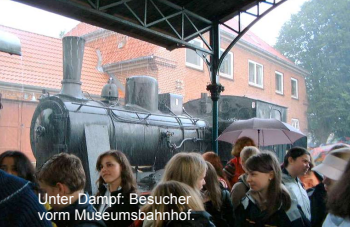
Unter Dampf: Besucher vorm Museumsbahnhof.