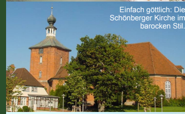
Einfach göttlich: Die Schönberger Kirche im barocken Stil.