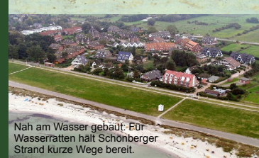
Nah am Wasser gebaut: Für Wasserratten hält Schönberger Strand kurze Wege bereit.