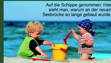
Auf die Schippe genommen: Hier sieht man, warum an der neuen Seebrücke so lange gebaut wurde.