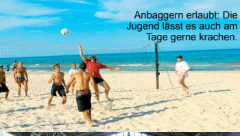
Anbaggern erlaubt: Die Jugend lässt es auch am Tage gerne krachen.