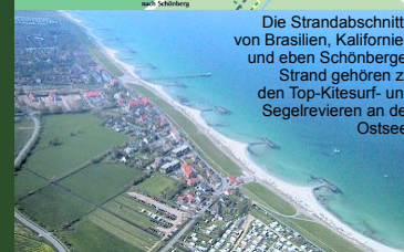
Die Strandabschnitte von Brasilien, Kalifornien und eben Schönberger Strand gehören zu den Top-Kitesurf- und Segelrevieren an der Ostsee.