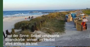
Fest der Sinne: Selbst verlassene Strandkörbe wirken im Herbst alles andere als trist.