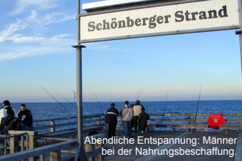
Abendliche Entspannung: Männer bei der Nahrungsbeschaffung.