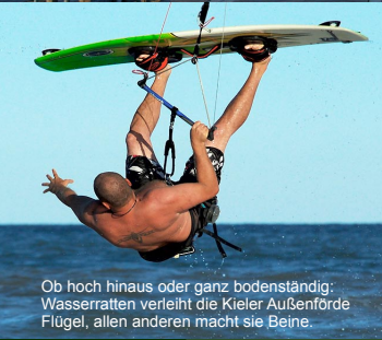
Ob hoch hinaus oder ganz bodenständig: Wasserratten verleiht die Kieler Außenförde Flügel, allen anderen macht sie Beine.

einmaligen regen Schienenverkehrs nach Schönberger Strand wach, als mondäne Städter mit Sonnenschirmen sich noch per Dampfkraft zu ihren Strandkörben kutschieren ließen. Ist ihnen nach Ausflügen zumute, dann gehen Sie doch auf Erlebnistörn mit der „Heikendorf“ direkt von der neuen Seebrücke aus. Besondere Höhepunkte sind auch die malerischen Yacht- und Fischereihäfen in unmittelbarer Nachbarschaft. An der Mole können Sie sich nicht nur die steife Brise um die Ohren wehen lassen, sondern frischen Fisch direkt von den Fischerbooten kaufen – oder gleich von Laboe aus mit Fördedampfern direkt in die Landeshauptstadt Kiel schippern. Shopping ohne Stress und Hektik bietet Ihnen natürlich auch die Probstei und ihr Hauptort Schönberg. Legen Sie Pausen in den zahlreichen Straßencafés ein, schlendern Sie im Anschluss über die Promenaden. Auf einigen Bauernhöfen, die sich während der Rapsblüte im Frühjahr als reizvolle Haltepunkte inmitten eines gelben Flickenteppichs abzeichnen, können Sie „heimische Produkte“ probieren und kaufen. Aber nicht nur der Hochsommer bietet Urlaubsfreuden pur. Die ersten Stürme, buntgefärbte Laublandschaften und die dunkelroten Sonnenuntergänge über dem Meer machen den Herbst zu einem Fest der Sinne. Klare Seeluft und unendlich weiße Weite erwartet Sie dann im Winter. Knirschender Schnee unter den Füßen, verschneite Wiesen und Strände, die zu Wanderungen in einer pittoresken Landschaft einladen. Kenner