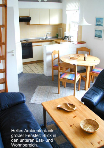
Helles Ambiente dank großer Fenster: Blick in den unteren Ess- und Wohnbereich.