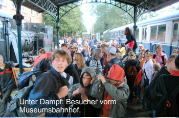
Unter Dampf: Besucher vorm Museumsbahnhof.